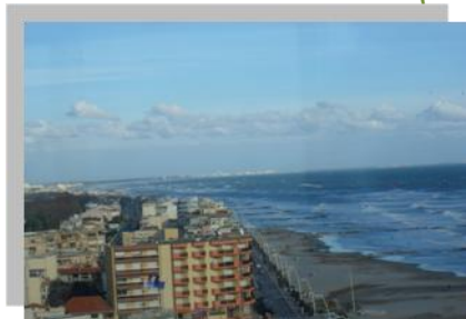
TGV vers Paris (306 Km/h) =>