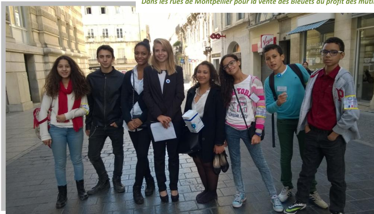
Dans les rues de Montpellier pour la vente des Bleuets au profit des mutilés de guerre