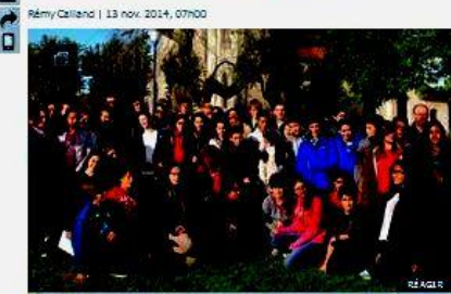
■ Chauconin-Neufmontiers, hier, Des collégiens de Rabat et de Fès ont découvert les lieux où a combattu la brigade marocaine. Il y a trois ans, un hommage avait été rendu dans la ville à ces soldats. (L.P./R.C. et G.C.)

Le Maroc était bien présent hier à Chauconin-Neufmontiers. Deux délégations de collégiens de Rabat et de Fès sont venues rendre hommage aux soldats de la brigade marocaine tombés ici le 5 septembre 1914, au début de la bataille de la Marne.