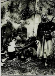
■ Tirailleurs (g.) ou spahis, les Marocains ont été plusieurs milliers à combattre sur le front.

Ghita, Lina, Mouâtaz et Naïm n'ont pas connu leur arrière-arrière-grand-père, soldat de 14. Mais, il y a quelque temps de cela, ils ont apporté au lycée de la Fontaine, à Fès, leur école, des livres militaires, des médailles, des photos, documents qui leur valent aujourd'hui ce déplacement, imaginé par une structure juvignacoise de rapatriés, Afa, l'association Fès amicale.