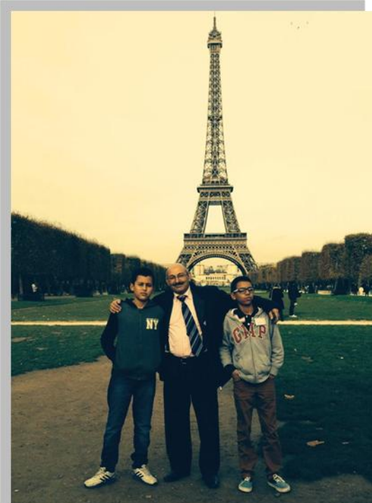
Tour Eiffel (324 m)