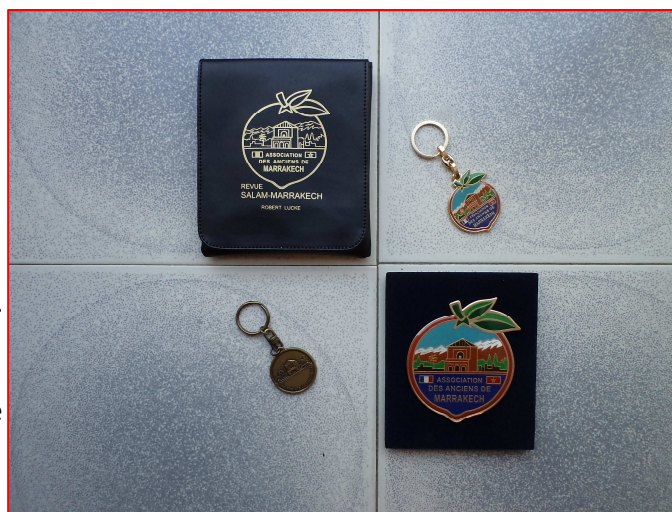
les logos des marrakchis

Salam-MRK compte près de 400 adhérents répartis, comme pour nous, sur tout le territoire métropolitain et aussi à l'Etranger. Le principal temps fort est le rassemblement organisé tous les ans au mois de juin, au Complexe de la