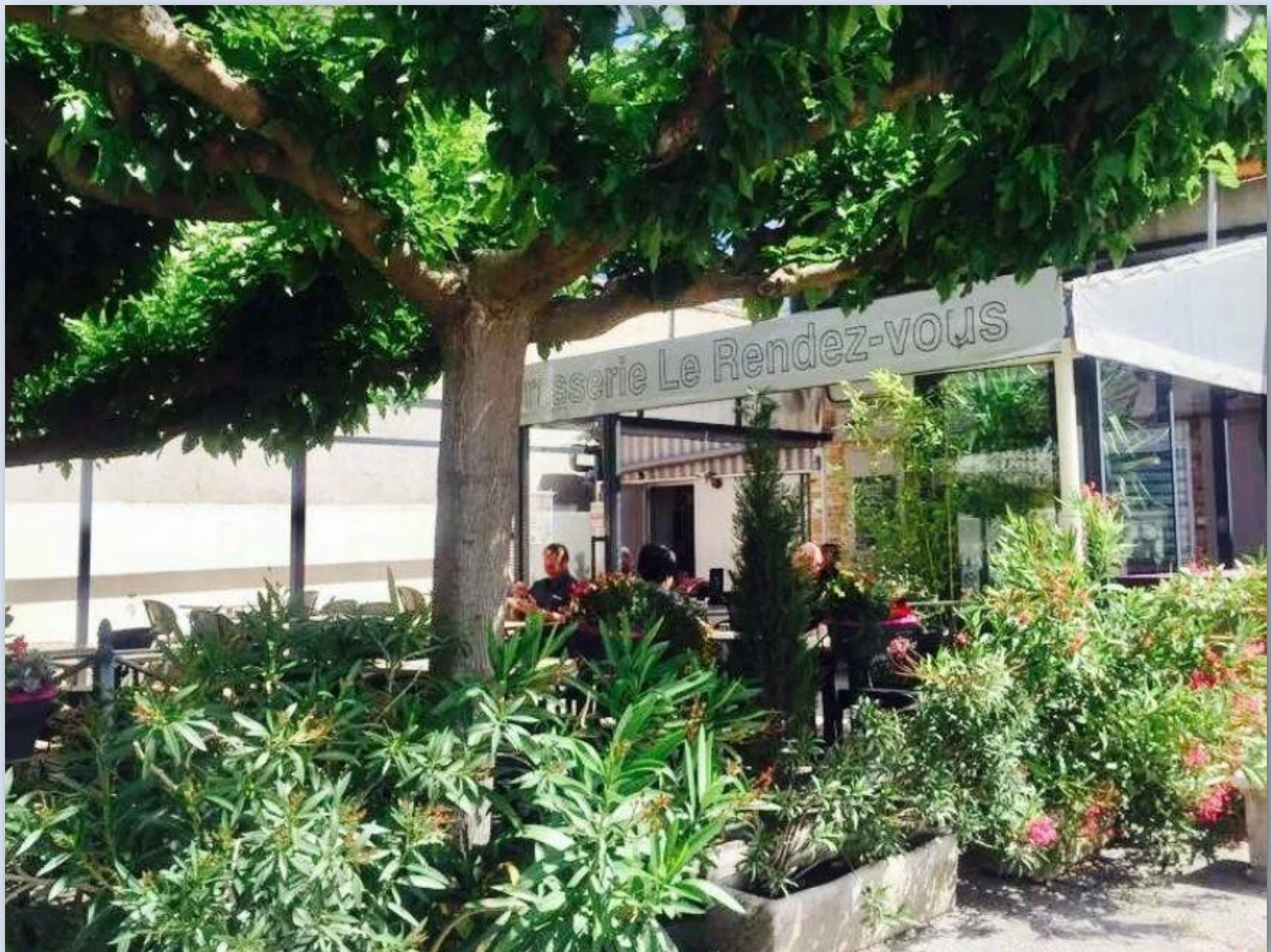
Repas sous les mûriers-platanes au restaurant Le Rendez-Vous à St-Rémy de Provence