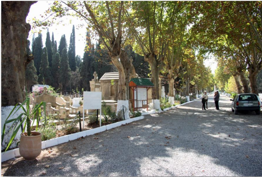
Fès, 2 novembre 2014 Cimetière européen de dar Mahrès