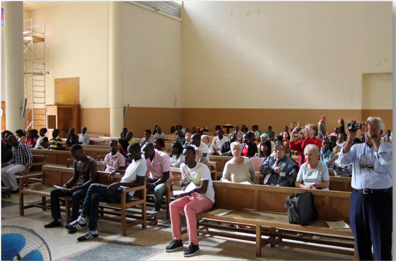
L'église a résonné des chants dans la ferveur de l'assistance