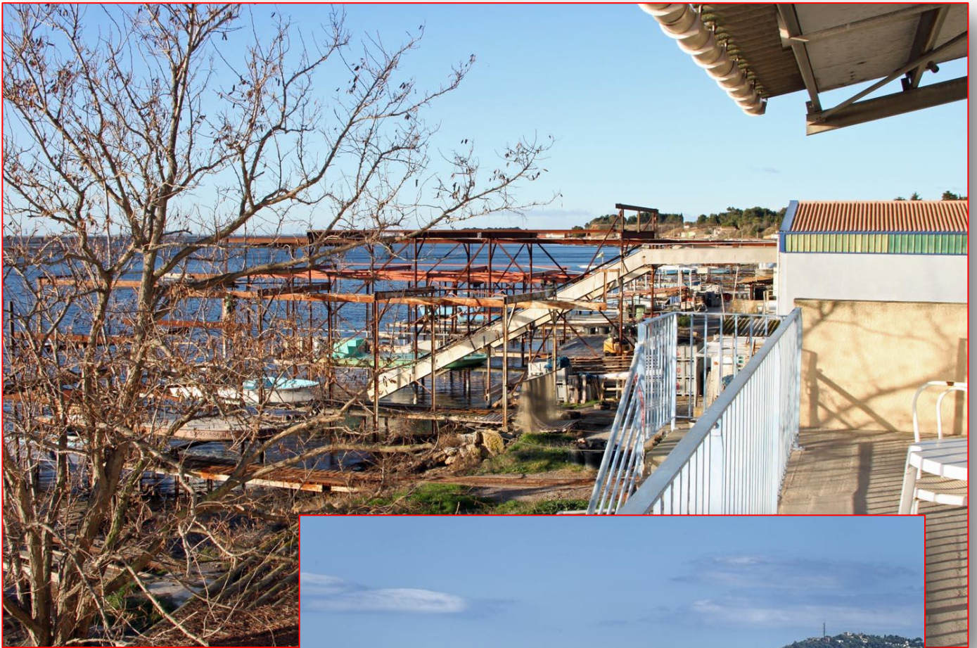
Bouzigues, sur l'étang de Thau, réputée pour ses productions conchylicoles