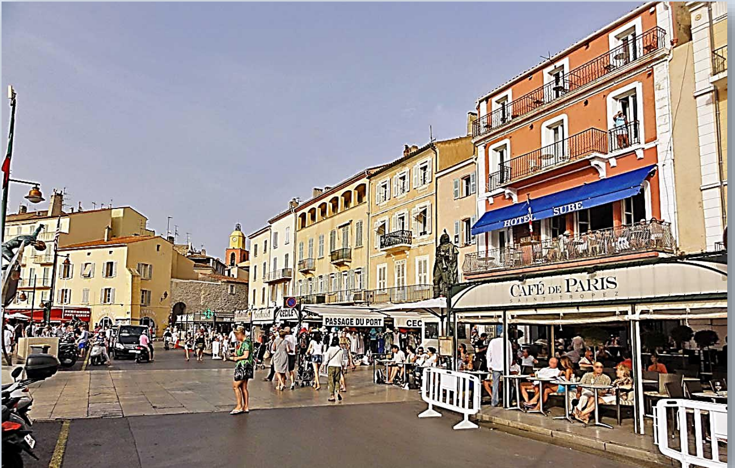
Promenade sur le Port et lèche-vitrines