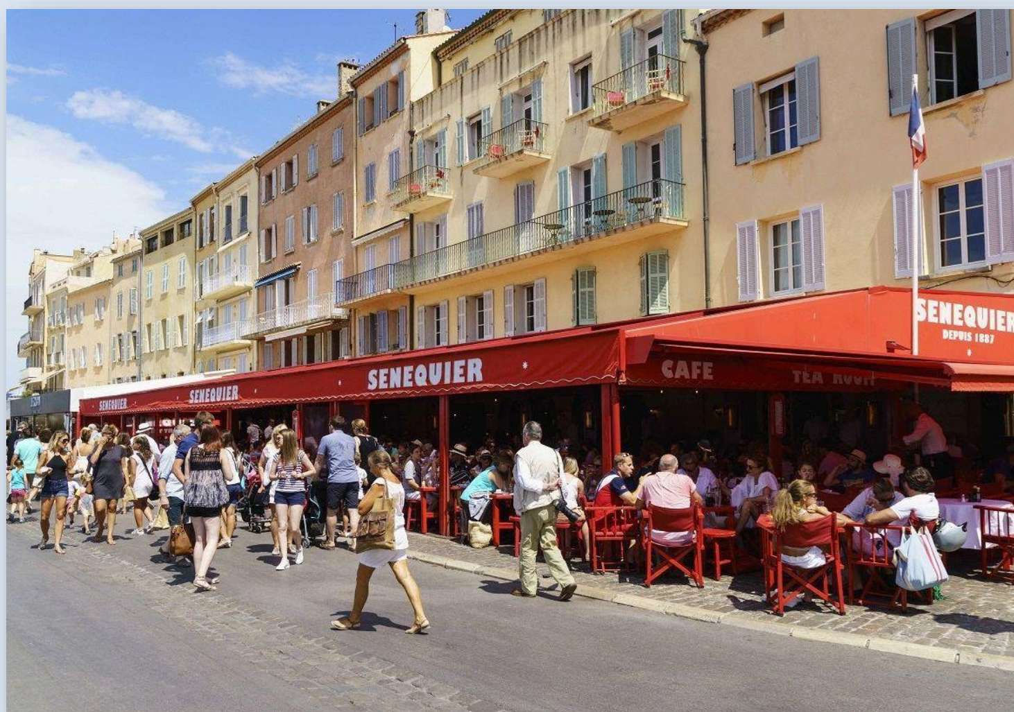
Sénéquier : le rendez-vous des stars ...