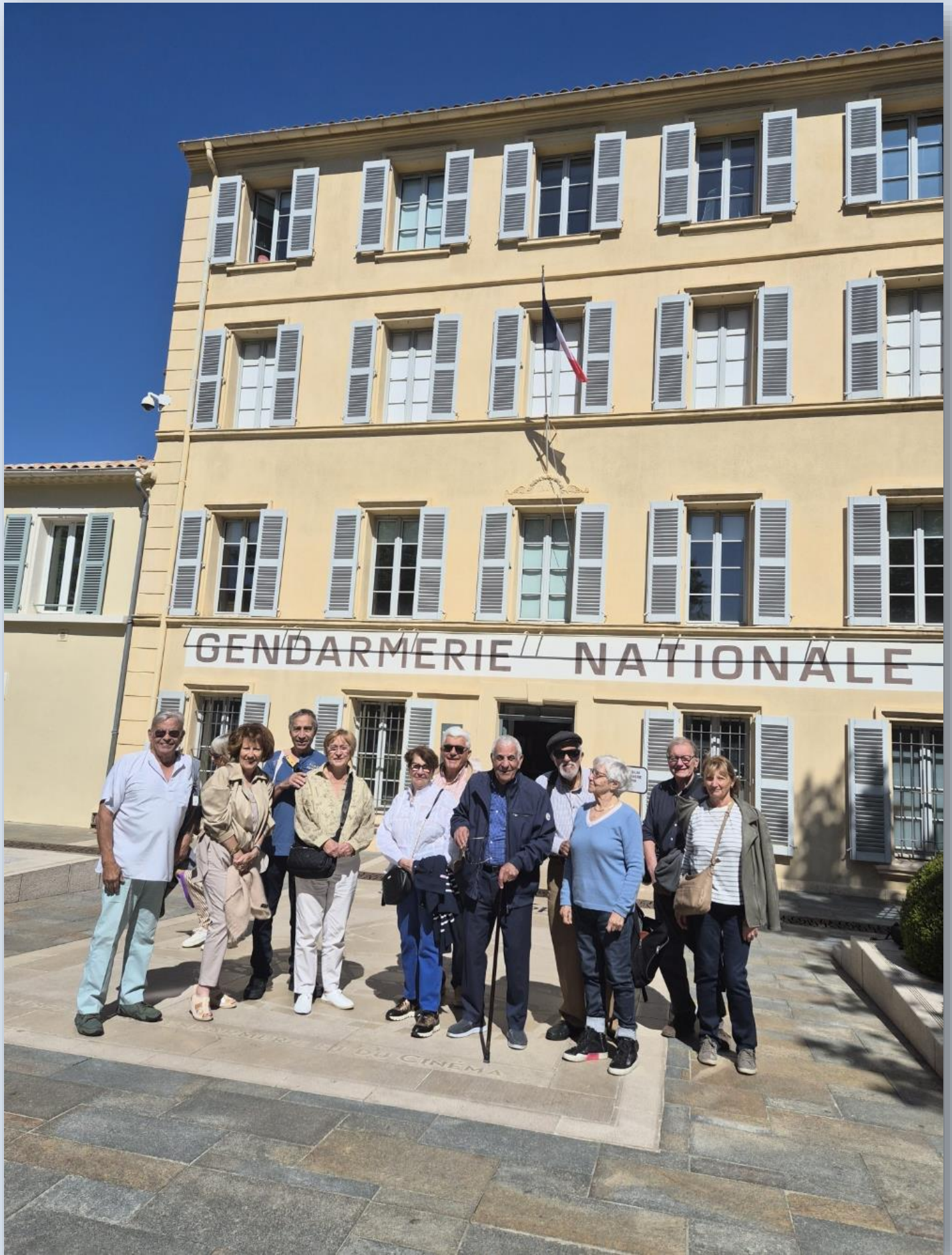
Immanquable à l'entrée de la ville ...