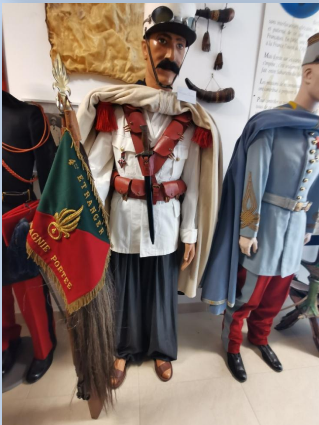
Le Spahis : soldat de la cavalerie portée, régiment faisant partie de l'Armée d'Afrique dissoute après la guerre d'Algérie