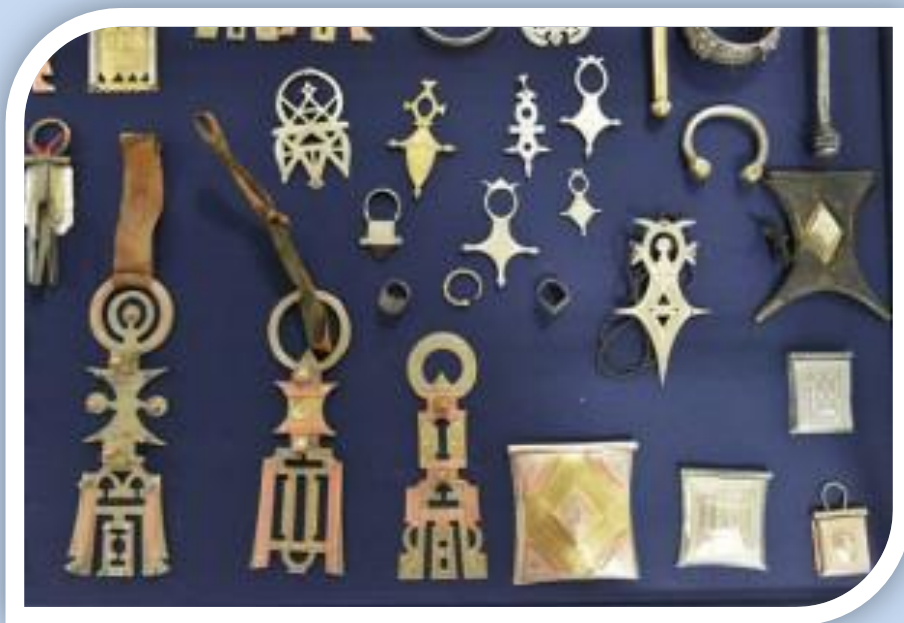
Bijoux : exposition de bijoux anciens traditionnels