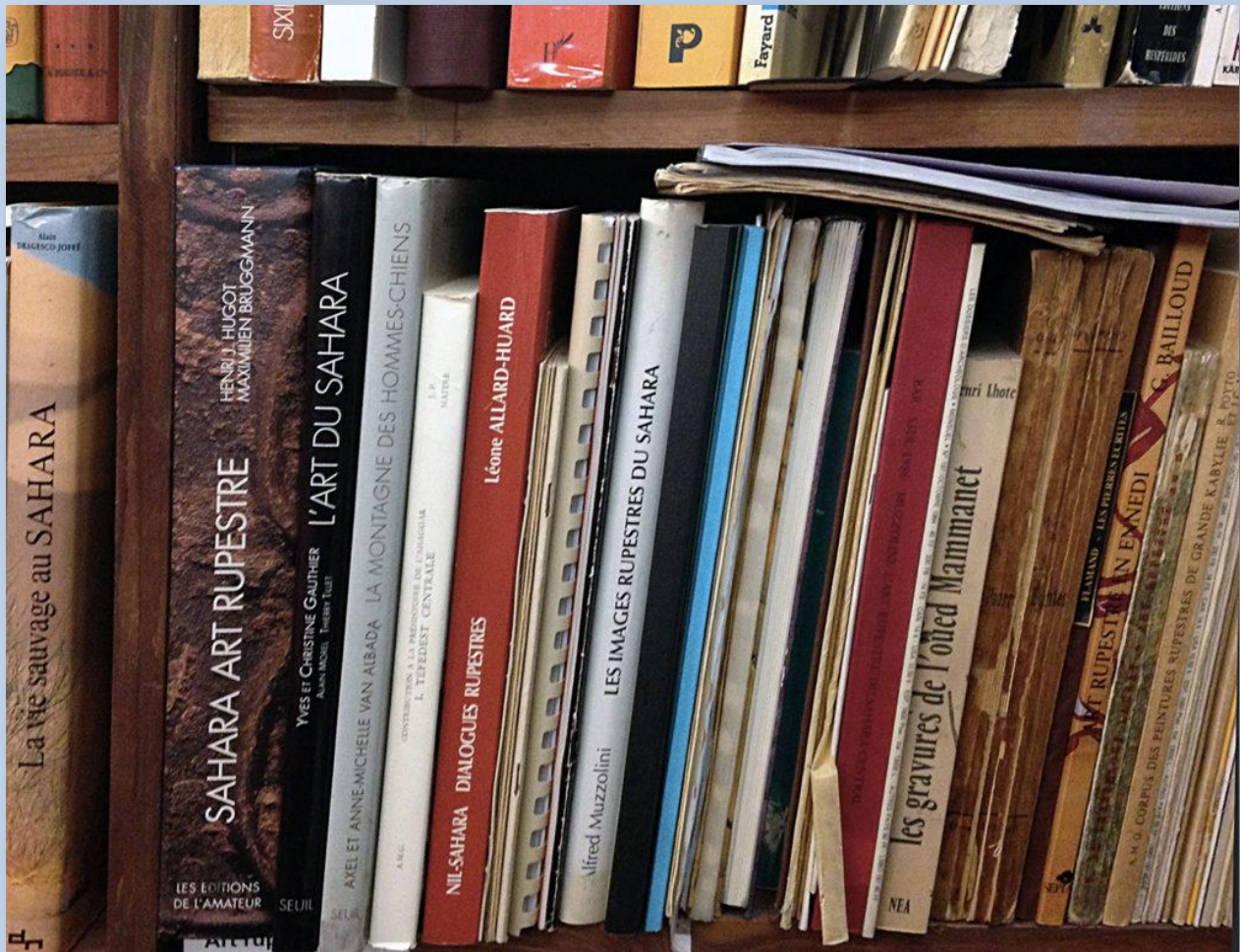
La bibliothèque compte 3.000 ouvrages entièrement consacrés au Sahara