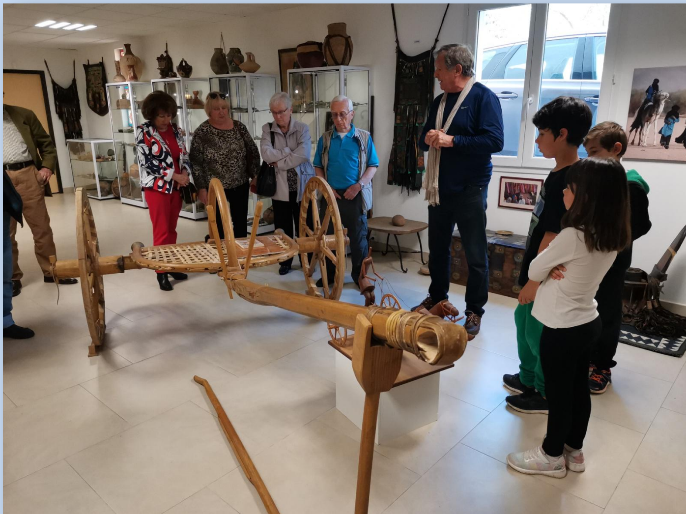
Une pièce rare de la collection déclarée unique au monde : char de combat utilisé par les nomades lors des razzias.