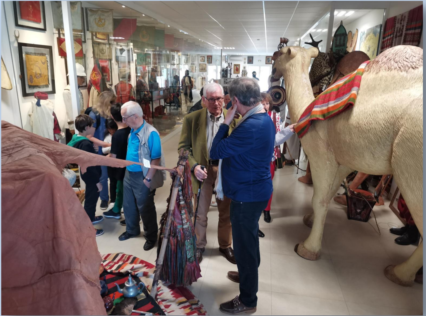
La Rahla : selle du dromadaire, le vaisseau du touareg et son campement