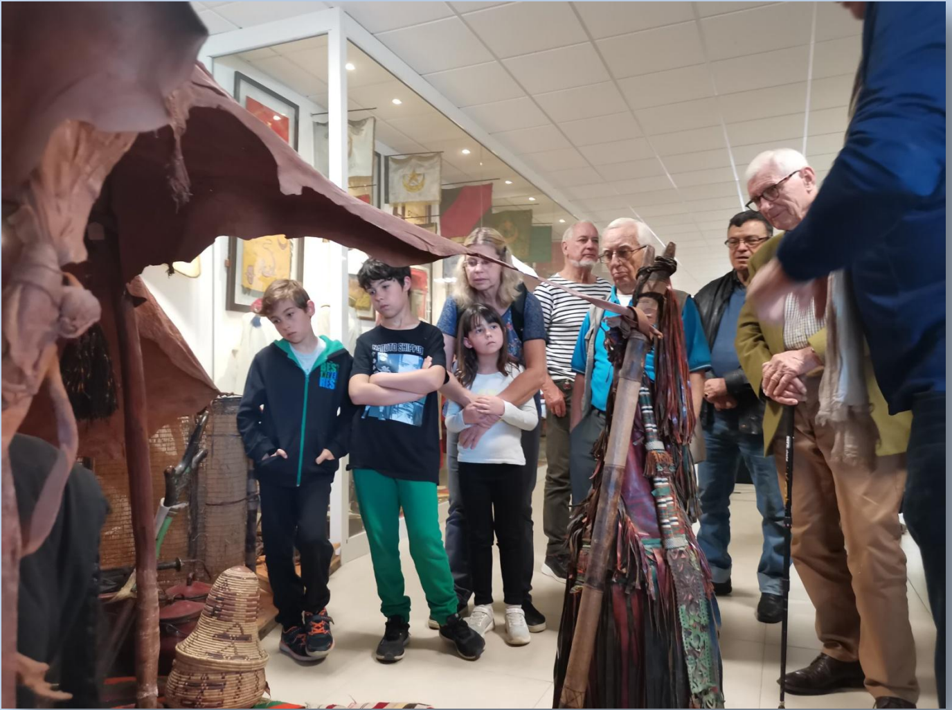
La Ghaima : tente en peaux de chèvres des oasiens