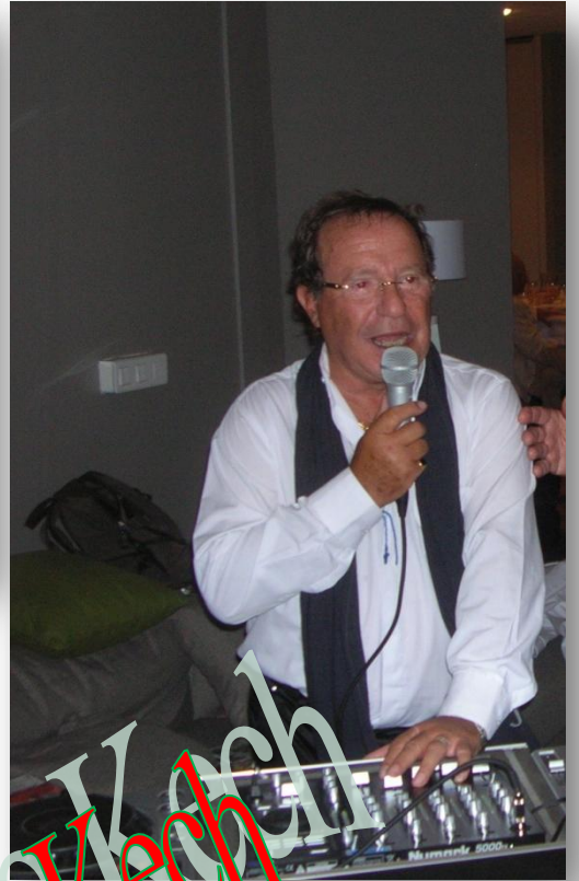
Comme attendu, il a mis le feu à la soirée !!!