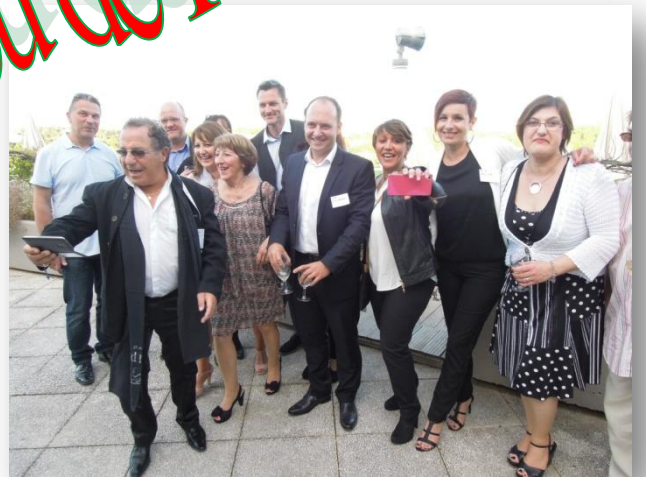
Toujours avec les jeunes